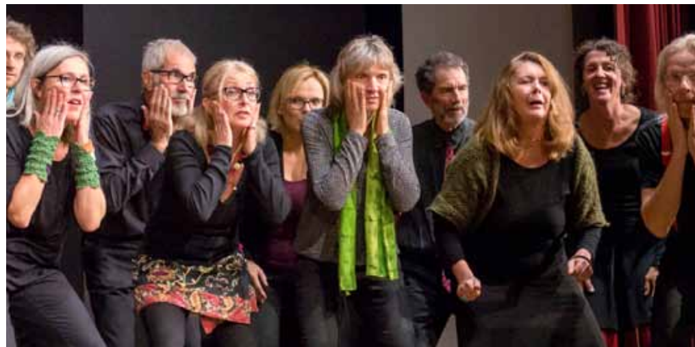
Chorklassen, the sweet 60s und Schall und Schmauch