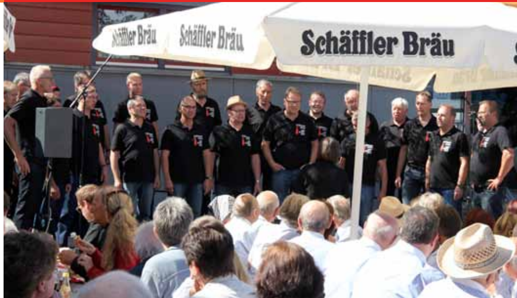
Ein voller Erfolg: die Chormatinee in Wildpoldsried

Sich Zeit für andere nehmen, dazu gehört natürlich auch die Vorbereitung des Festkonzerts. Für sein außerordentliches