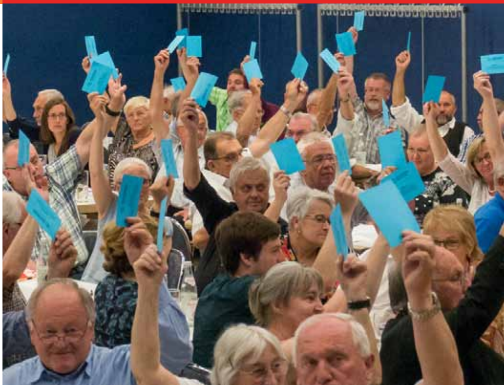
Die Delegierten haben es schon im Mai beschlossen - der Chorverband Bayerisch-Schwaben beendet die Mitgliedschaft im DCV

Für alle Chöre entfällt die Zwangsabnahme der Zeitschrift „Chorzeit“ und damit der bisherige DCV-Sockelbeitrag in Höhe