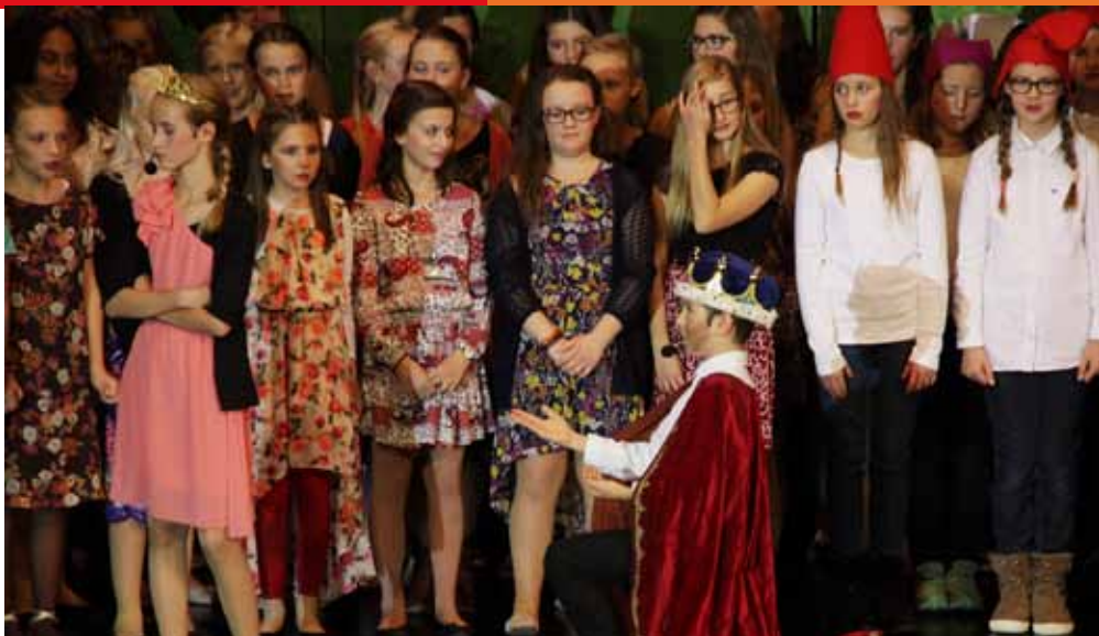
König Laurin und sein Rosengarten: Ein mitreißendes Musical in Dillingen

Ungewöhnliche Klangfarben und Raps ziehen die Zuhörer in ihren Bann. Durch