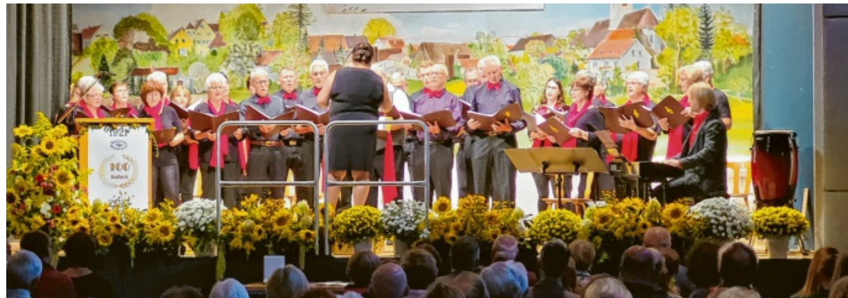
Die Chorgemeinschaft Holzschwang feierte mit Verspätung ihr 100-jähriges Bestehen. Zum Jubiläumskonzert kamen gut 200 Besucherinnen und Besucher.