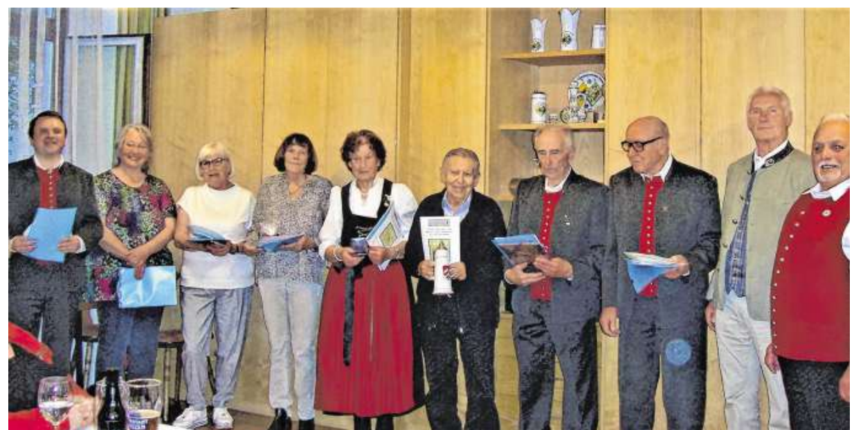
EHRENABEND Nach nun mehr als zwei Jahren konnte die Chorgemeinschaft Dietmannsried e.V. ihre aktiven Sängerinnen und Sängern bei einem gelungenen Ehrungsabend ihre langjährige Sängertätigkeit würdigen. Traditionell fanden die Ehrungen immer bei der Jahresabschlussfeier statt. Viele Chöre haben eine schwierige Zeit hinter sich, in welcher das Singen nicht immer erlaubt war.