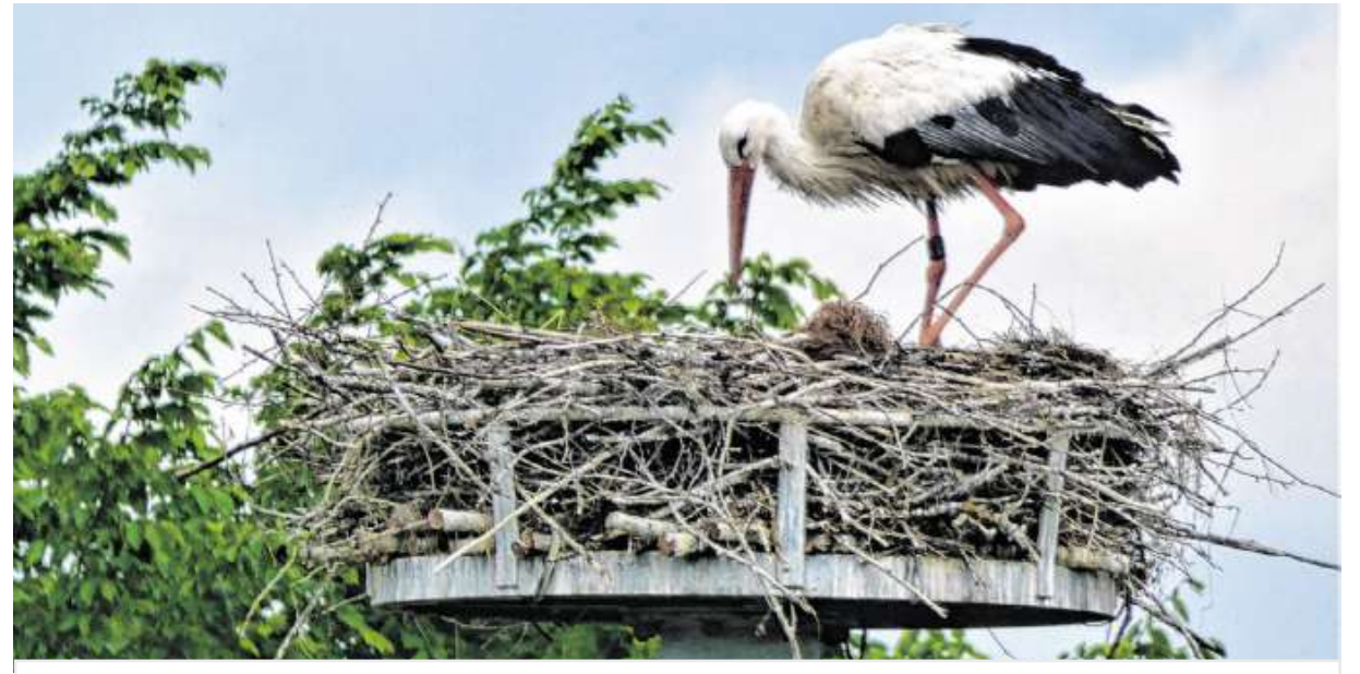
TIERISCHE SENSATION Seit Menschengedenken brütet im Oberallgäu wieder ein Storchenpaar – und das mit Erfolg. In dem von der Naturschutzgruppe Altusried/Wiggensbach und den LEW aufgestellten Kunsthorst betteln zwei Jungstörche um Futter. Falls alles glatt verläuft, werden die Jungen in etwa einem Monat flügge und ziehen mit ihren Eltern weg von Krugzell