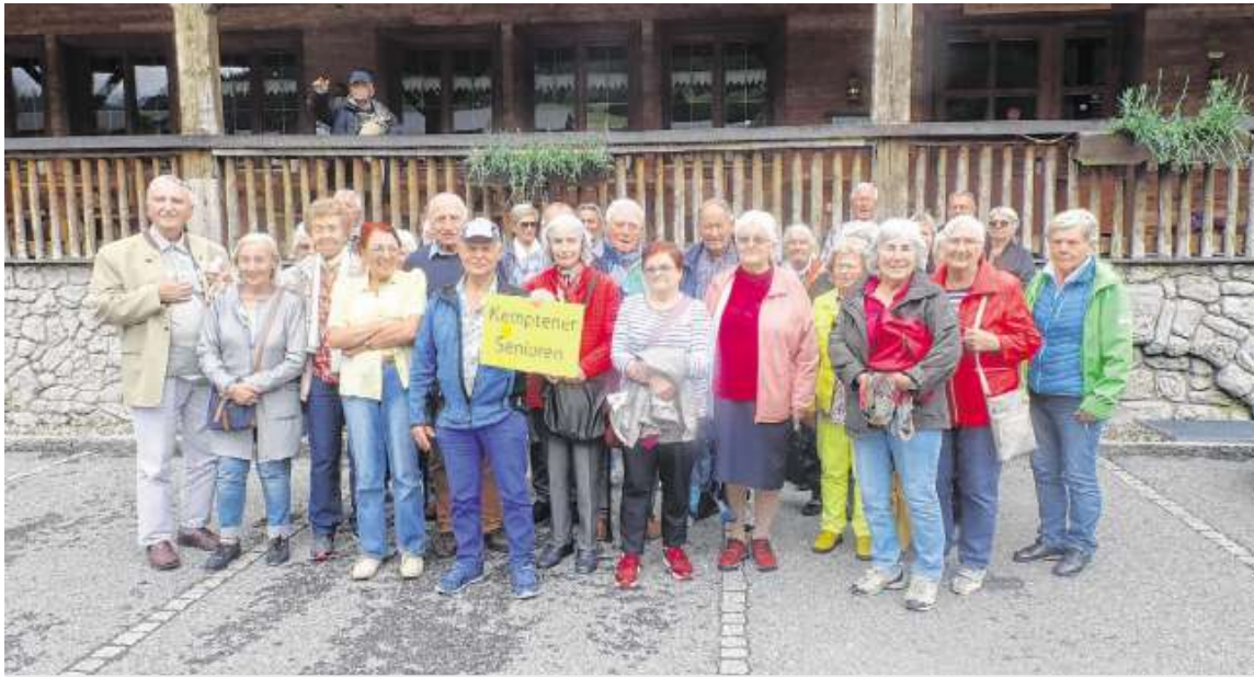
FRÜHLINGSAUSFLUG Der 3. Ausflug der Kemptener Senioren führte sie ins Große Walsertal. Mit durchwachsenem Wetter erkundeten sie die Ursprünge des Tals. Die heutigen Walser kamen damals aus dem Schweizer Kanton Wallis in das Gebiet, rodeten das Gelände, sodass nun ca. 3500 Einwohner dort leben können.