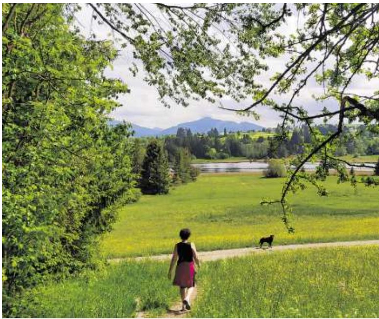
WEITBLICK Bei einer wunderschönen Wanderung am Schwarzenberger Weiher in Oy kann der freie Blick auf die Reuterwanne genossen werden. Der ruhige, abgelegene Ort dient als Abwechslung und Ruheoase für Einheimische.