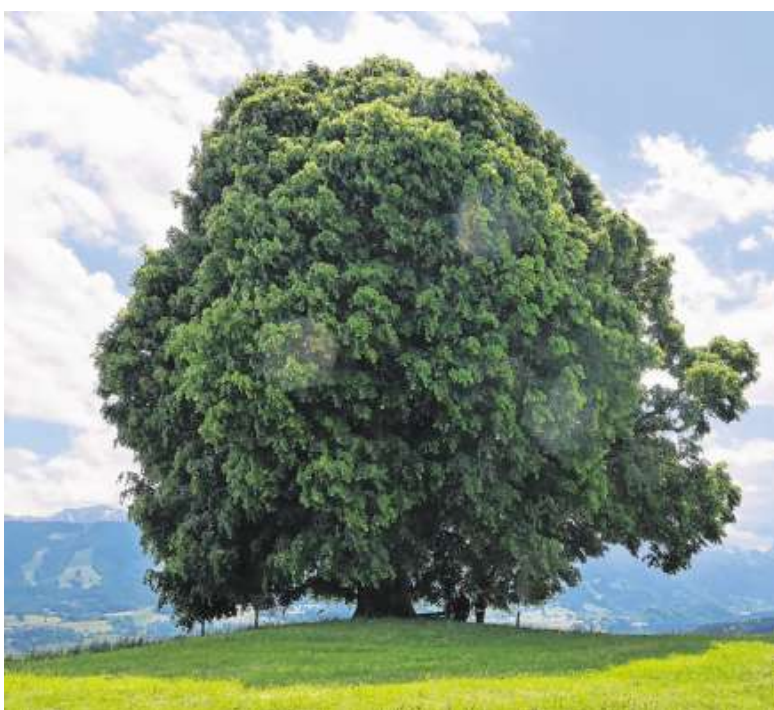
UNTER DER LINDE Auf der Wittelsbacher Höhe bei Ofterschwang thronet die imposante Linde. Ihre wunderschöne, grüne Krone spendet Ruhe und Kraft und hinterlässt bei ihren Besuchern das Gefühl von Geborgenheit.