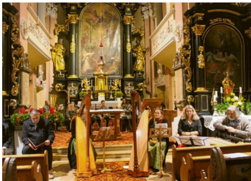
Viele heimische Musikgruppen gestalteten das Adventskonzert in der Affinger Pfarrkirche.