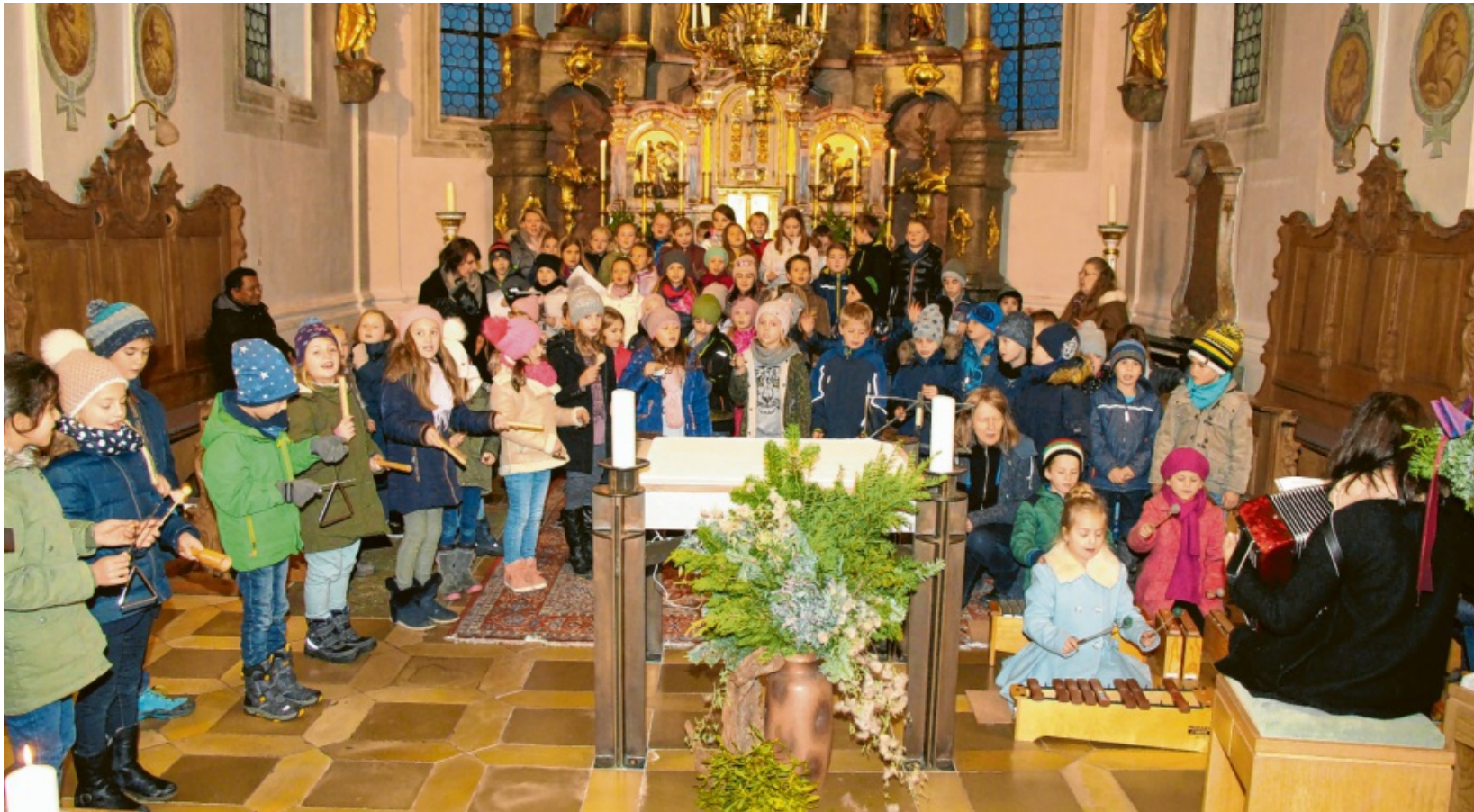
Mit über 60 Kindern plus Lehrkräften versammelte sich die Grundschule zu ihren Beiträgen zum Adventskonzert im Altarraum. Alle Mitwirkenden erteten viel Lob und Anerkennung.