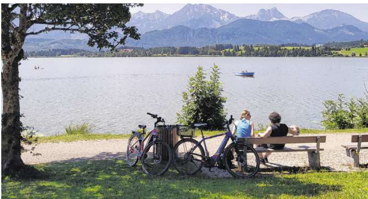
MIT DEM RAD DURCHS ALLGÄU „Eine Etappe des Allgäu-Radwanderweges führt von Füssen zum Hopfensee“, weiß unsere Leserin Annemarie Augsten aus Kempten. Der Hopfensee lädt dabei zum Rastmachen ein, wie es diese zwei Radler tun. Im Hintergrund zeigt sich der Aggenstein bei Pfronten mit seiner markanten Form. Weiter führt die Route dann nach Pfronten.