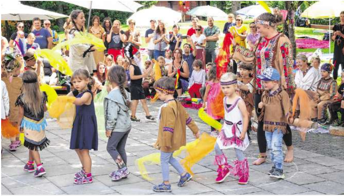
SOMMERFEST Tanz und buntes Treiben: Beim Sommerfest im Kindergarten Trauchgau durften sich Kinder wie Erzieherinnen und Erzieher in Schale werfen. Denn auf dem Programm stand auch ein Indianertanz mit knalligen Tüchern.