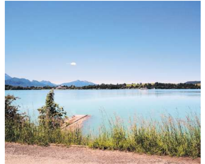
FAST WOLKENLOS Dieses idyllische Bild hat unser Leser Robert Riegelbeck bei einem Spaziergang am Forggensee in Schwangau-Walthenhofen unterhalb der Kirche und dem Segelclub, mit Blick Richtung Festspielhaus aufgenommen.

SENDEN SIE UNS IHRE FOTOS Haben auch Sie ein Foto für unsere Seite „Leute vor der Kamera“? Wir freuen uns auf Ihre Bilder. Per E-Mail an extra.fuessen@azv.de . Bildgröße jpg mindestens 1,5 MB. Bitte schreiben Sie uns, bei welcher Gelegenheit das Foto entstand, Vor- und Zunamen der abgebildeten Personen sowie des Fotografen – sonst können wir Ihre Aufnahmen aus rechtlichen Gründen nicht veröffentlichen. Mit der Einsendung Ihres Fotos geben Sie die Zustimmung, dass dieses auch auf der Internetseite des Wochenblattes extra unter www.wochenblatt-extra.de veröffentlicht wird. Es besteht kein Anspruch auf Veröffentlichung.