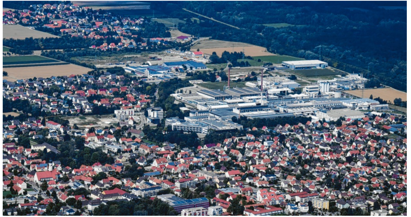
Dank Bahn und Lechtal eine zentrale Marktgemeinde im nördlichen Landkreis Augsburg: Meitingen.

Während seiner Zeit als Chef im Rathaus von 1984 bis 2008 wurde aus einer 9000-Einwohner-Gemeinde ein Markt mit mehr als 11.000 Einwohnerinnen und Einwohnern. Auf Wikipedia steht: „Infolge des Wachstums und der Bedeutung für das Umland wurde Meitingen 1989 zum Markt erhoben.“ Verliehen wurde das Prädikat „Markt“ vom damaligen bayerischen Innenminister Edmund Stoiber, wie Sartor weiß. „Das war ein Top-Fest. Da war eine Woche lang wirklich Hochbetrieb in Meitingen.“ Eine Broschüre des Marktes von 1998 zeigt in einem Rückblick Bilder der Feier. Festlich gekleidete, lachende Menschen auf Bierbänken sind da zu sehen. Sie haben Maßkrüge vor sich stehen und schwingen Fähnchen, die geschwungene rote Linien zeigen, das Meitinger Logo. Die Markterhebung war für Sartor nicht