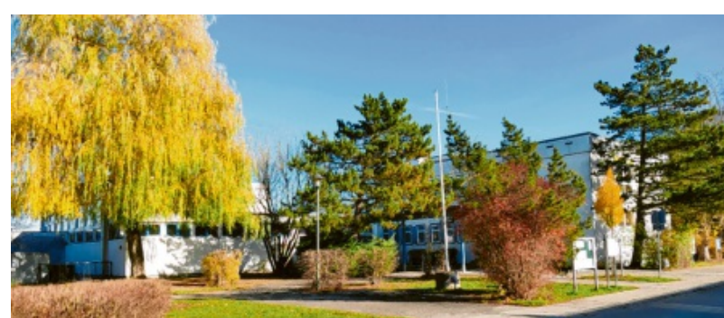
Fast wie im Dornröschenschlaf liegt die Grundschule in der Siedlung. Doch dieser Eindruck wird sich ändern, wenn die Bauarbeiten beginnen.

Die erforderlichen Arbeiten sollen laut Planung zum größten Teil in den Ferien stattfinden, um den Schulbetrieb so wenig wie möglich zu stören.