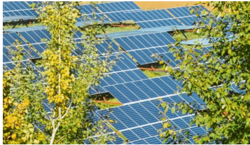
Bei Meitingen soll ein Park mit Solarkollektoren entstehen.

Das ist bei der zweiten, 3400 Quadratmeter großen Fläche anders. Diese liegt neben dem Bauhof beziehungsweise dem Bayerischen Roten Kreuz (in Richtung Lech) und grenzt an die Bernhard-Monath-Straße an. Das Problem: Auf der Nord- und Ostseite des geplanten Solarparks gibt es Anwohner. Das führte zu Diskussionen im Gemeinderat. Hintergrund: Die beiden