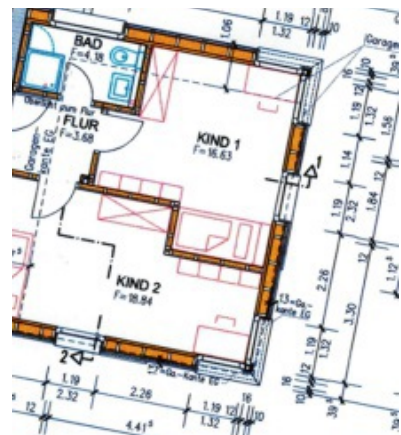
Wer in Weißhorn bauen will, muss Punkte sammeln.