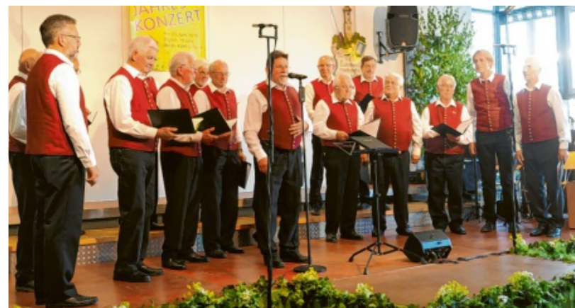
Der Liederkranz Pfaffenhofen sang ein verspätetes Frühjahrskonzert in der Hermann-Köhl-Schule.

Zum Finale des Jahreskonzerts kamen die Sänger aus Pfaffenhofen und Krumbach gemeinsam auf die Bühne und sangen, mit Unterstützung des Publikums, den irischen Reisesegen „Möge die Straße uns zusammenführen“.