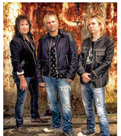
Die Band Spirit of Smokie tritt am Ostermontag im Four Corners auf.

📍 Karten gibt es im Internet unter www.fourcorners.de oder unter der Telefonnummer 08232/904841.